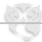
Tabla CCA: Principales características de los instrumentos de capital regulador y otros instrumentos admisibles como TLAC- no aplica

APR: Activos ponderados por Riesgo, definido por el importe resultante de multiplicar por 12.5 la exigencia de capital mínimo total (por riesgo de crédito, por riesgo de mercado y por riesgo operacional)